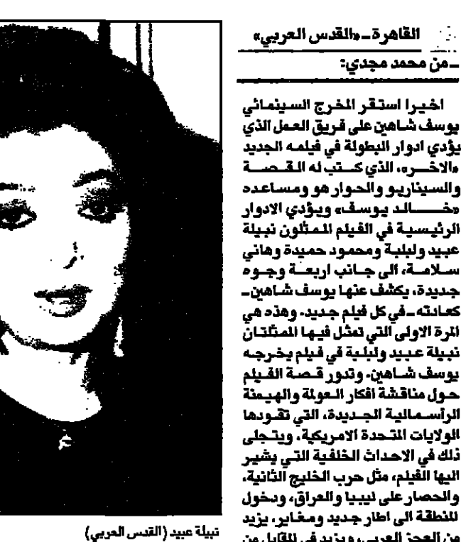
نبيلة عبيد